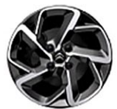
SAN DIEGO Hliníkové disky 16"