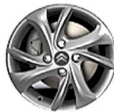
TUORLA Hliníkové disky 15"