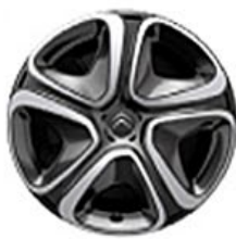
3D Okrasný kryt 16"