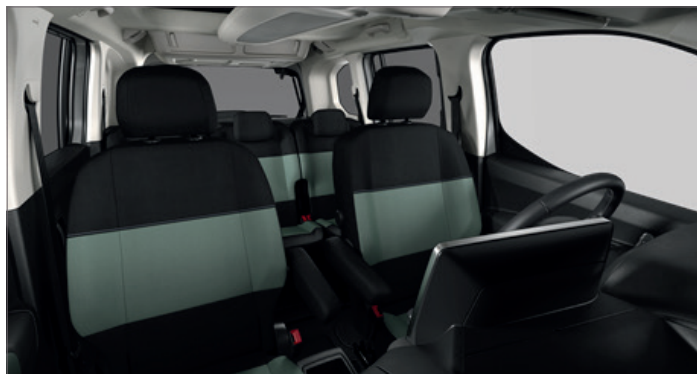
Sériový interiér pro FEEL a SHINE OEFQ - Látká MICA Zelená