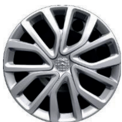
Okrasný kryt TWIRL R16