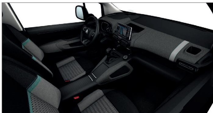
Příplatkový interiér OFFT - Látká LINE Šedá / Metropolitan - středová konzola CU26 je samostatná příplatková výbava