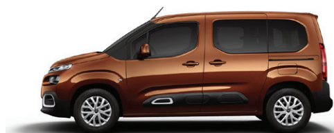
Měděná COPPER (M)