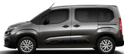
Šedá PLATINIUM (M)