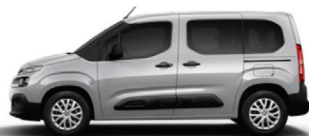
Šedá ARTENSE (M)