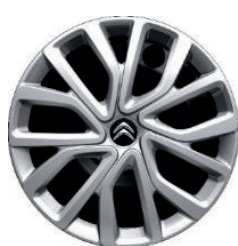
Okrasný kryt TWIRL R16 - černý střed