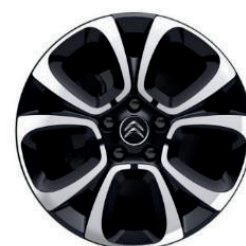
Hliníkový disk SPIN R17