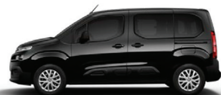
Černá PERLA NERA (M)