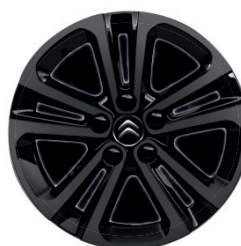
Hliníkový disk (celo-černý) STARLIT R16