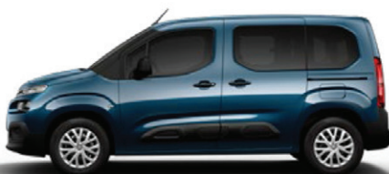
Modrá DEEP (M)