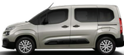
Běžová SABLE (M)